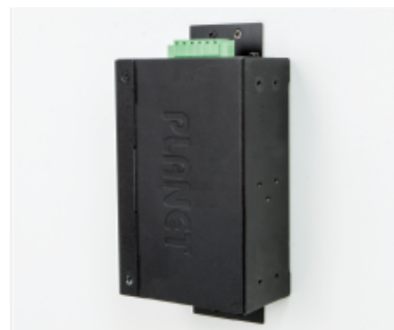
Side Wall Mounting (Space saving)