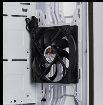
240mm or 280mm or 360mm ( radiator )