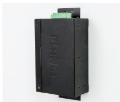
Side Wall Mounting (Space saving)